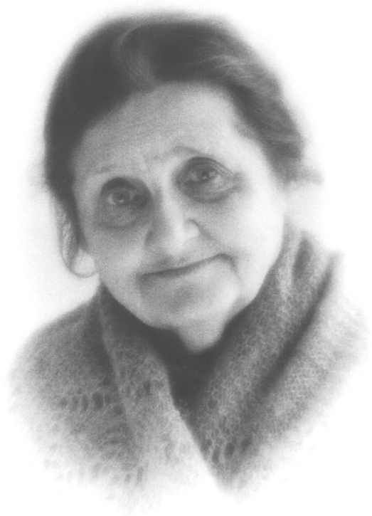
Н. Л. Трауберг, 2005 г.