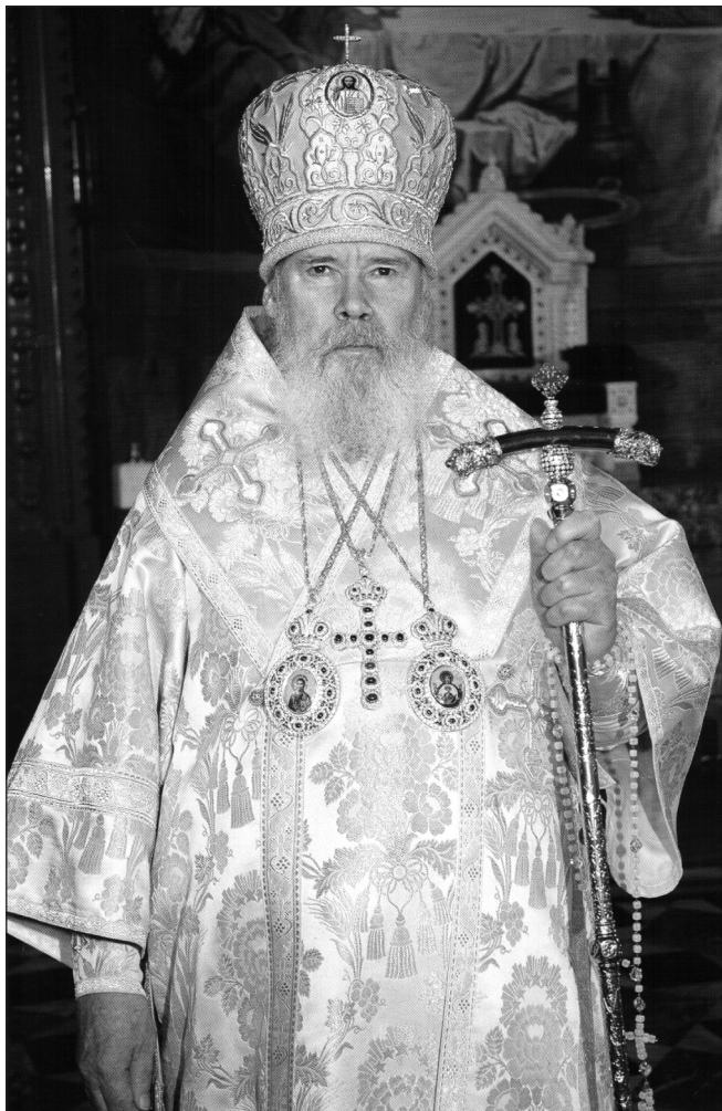
Патриарх Московский и всея Руси Алексий II 23.02.1929 – 05.12.2008