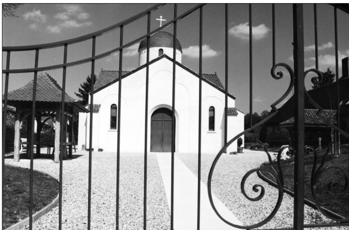
Бюси-ан-От. Церковь во имя Преображения Господня